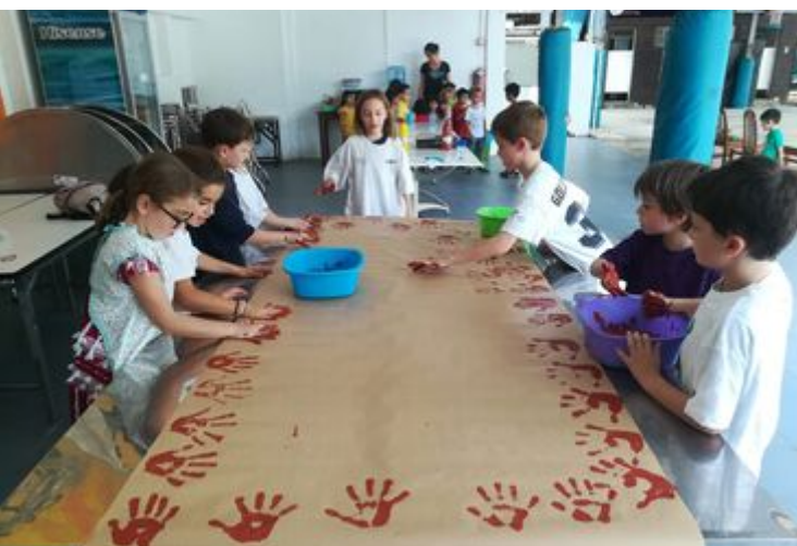
Les CE1 et CE2 en pleine réalisation de peintures rupestres pour la confection d'une grotte dans leur classe ...

Les 6ème et les 5ème ont pu réfléchir et expérimenter sur la lumière et les phénomènes de réflexion. La photo comme produit fini dans une première étape, avant de les modifier via un logiciel de retouches d'images, et d'en créer une oeuvre digitale s'éloignant de la photo originale.