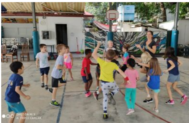
Les CE1 en séance d'EPS